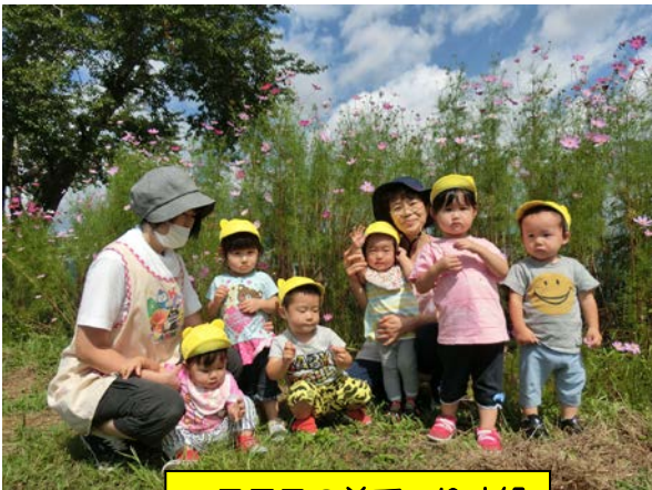
コスモスの前で りす組