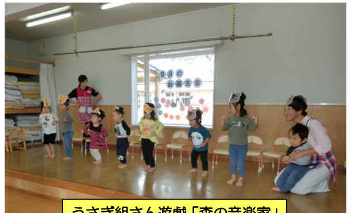
うさぎ組さん遊戯「森の音楽家」