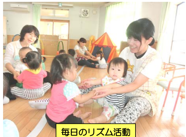
毎日のリズム活動