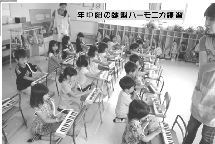
年中組の鍵盤ハーモニカ練習