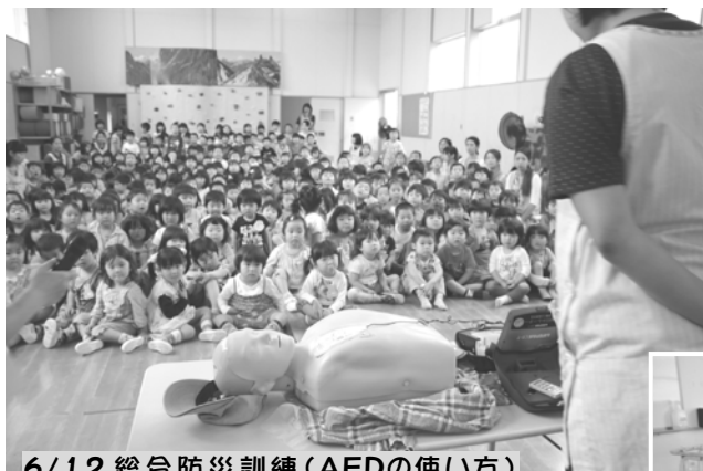
6/12 総合防災訓練(AEDの使い方)

7月の夏休みに入る前の期間と8月の休み明け後の1週間程度を「夏の特別活動」として前期・後期に分けて行います。夏休み前、園児にとって一番の楽しみは、「サンサン元気夏祭り」です。父母の会役員の皆様にもご協力をいただき、楽しくにぎやかに開催したいと準備を始めています。さらに特別活動は、グループに分かれたり、異年齢での交流を活発にしたり、製作や表現活動、自然活動やクッキングなど、普段できないようなことも計画しています。これからの夏の活動に生き生きと取り組むためには、リズム正しい生活がとても大切です。早寝早起きの習慣としっかりと食事を取ることをご家庭でも心掛けてください。