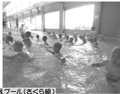
登米市民プール(さくら組)