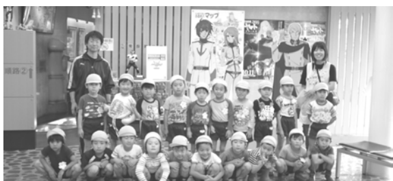
雨の日に宇宙戦艦ヤマトを見学に(さくら組)