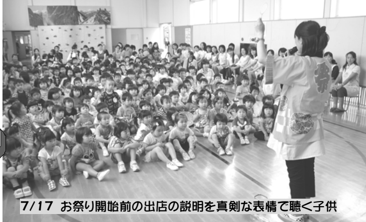
7/17 お祭り開始前の出店の説明を真剣な表情で聴く子供