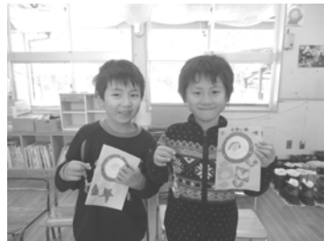
お母さんへのプレゼント完成!