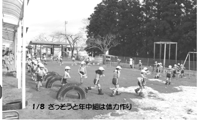
1/8 さつそうと年中組は体力作り