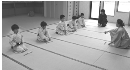
発表会の踊りの練習も本格的です