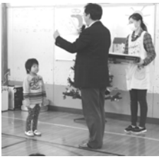
絵画展に入賞の表彰