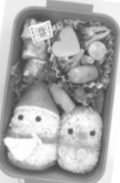
ステキなサンタ弁当