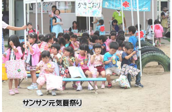
サンサン元気夏祭り

夏の特別活動[前期]最大のお楽しみ、“サンサン元気夏祭り”は、出店開店前を太鼓や踊りで盛り上げて、さくら組園児の「いらっしゃいませー!」の掛け声が園内に響き渡る中、梅雨特有の蒸し暑さを吹き飛ばすように始まりました。かき氷とポップコーンコーナーは大盛況で、ベンチに座