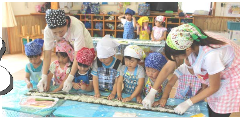
7/13 ひよこ組クッキング なが〜いのりまき作り