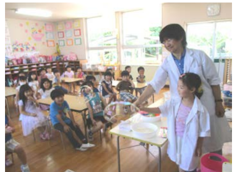
科学実験教室「シャボン玉」

1学期中のさまざまな行事や体験活動を通して、園児も私達も十分に園生活を楽しみ、学年ごとの目標もほぼ達成することができました。2学期は園児たちがぐーんと成長する学期となります。私たちも充実した2学期の活動に繋がるように、園児ひとりひとりの成長を確認し、職員研修や休暇を利用して十分鋭気を養い、力を蓄えておきます。