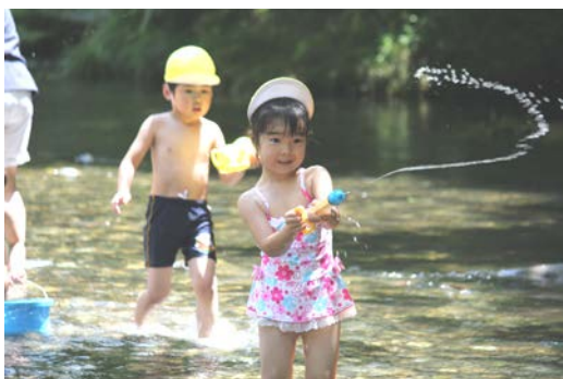
さくら組とひよこ組三滝堂で交流遊び