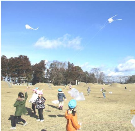
お正月あそび 諏訪公園でたこあげ