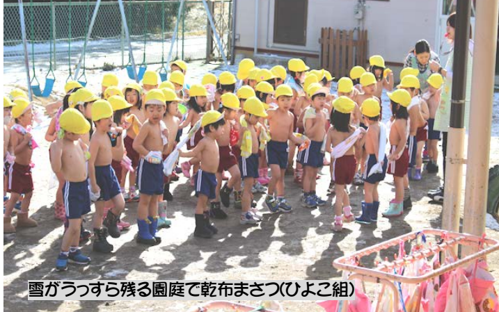
雪がうつつら残る園庭で乾布まつ(ひよこ組)