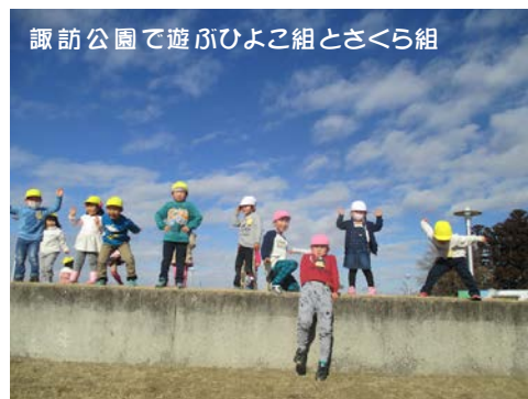
諏訪公園で遊ぶひよこ組とさくら組