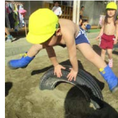
ひよこ組の タイヤ跳び