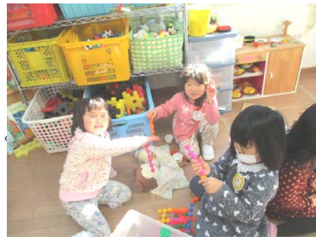
陽だまりのテラスで ごっこ遊びを楽しむ年中組