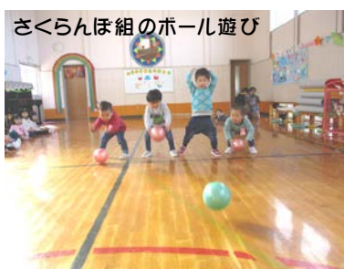
さくらんぼ組のボール遊び