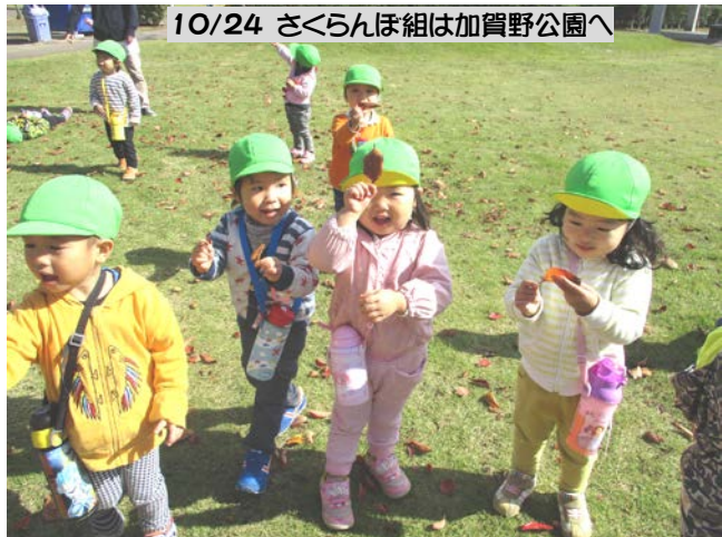
10/24 さくらんぼ組は加賀野公園へ