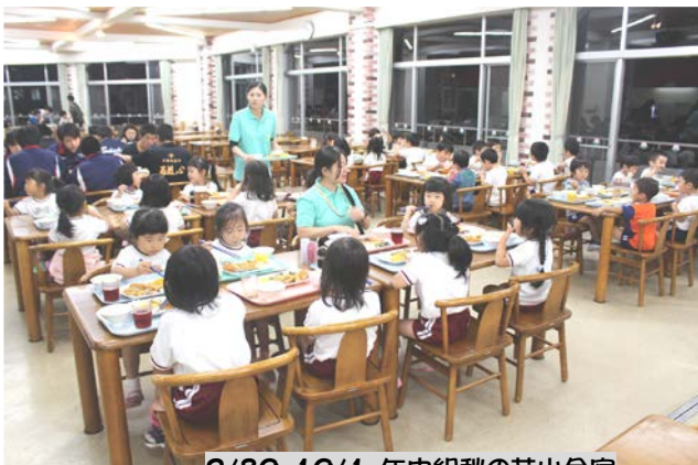
9/30、10/1 年中組秋の花山合宿