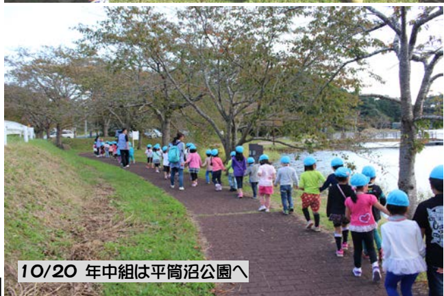
10/20 年中組は平筒沼公園へ