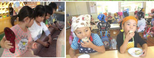
10/26 年中組サツマイモご飯をおにぎりに食べる