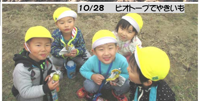
10/28 ヒートーフでやきいも