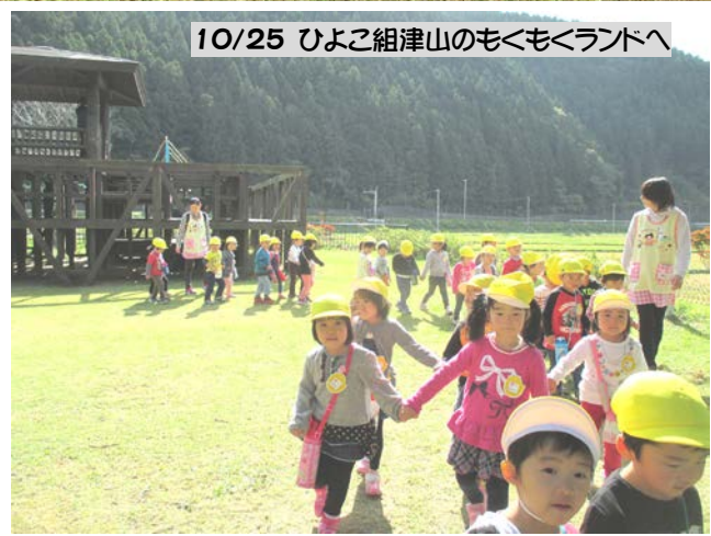
10/25 ひよこ組津山のもくもくランドへ