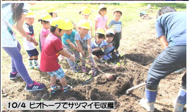
10/4 ヒートーフでサツマイモ収穫