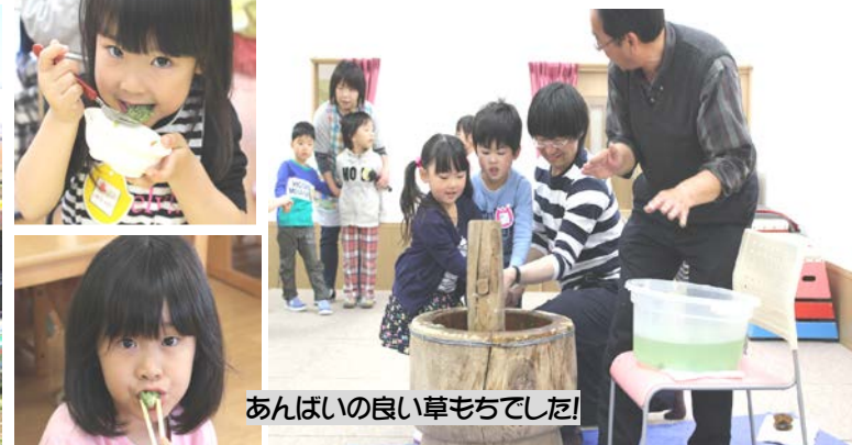
あんぱいの良い草もちでした!