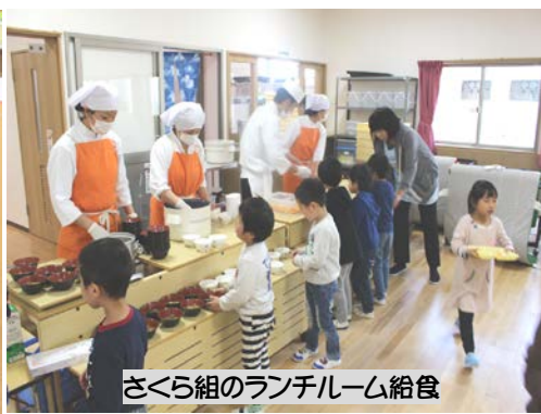
さくら組のランチルーム給食

お昼の給食... 「うわ~、めつちゃおいしい! こんなにおいしかったっけ!」と、みそ汁を一口飲んで大感激していました。さくらB組