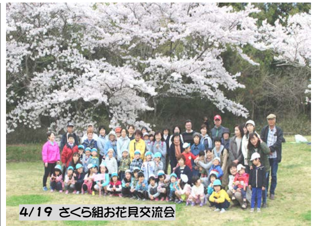
4/19 さくら組お花見交流会