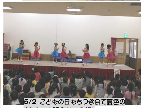
5/2 こどもの日もちつき会で夏色のナンシーを踊る(さくら組)