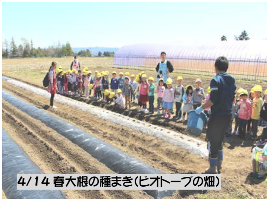
4/14 春大根の種まき(ピオトーフの畑)