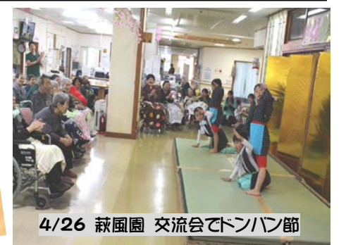
4/26 萩風園 交流会でドンパン節