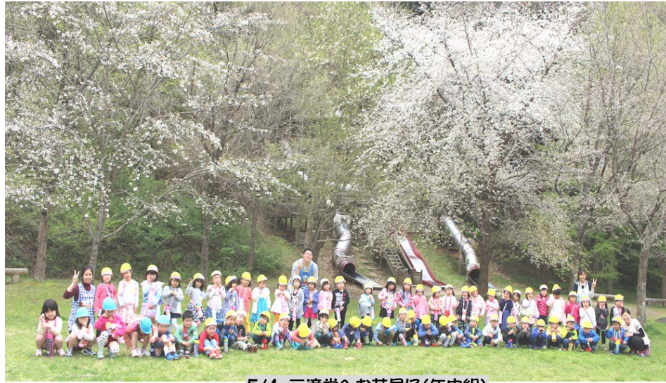
5/1 三滝堂へお花見に(年中組)