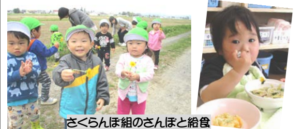
さくらんぼ組のさんぽと給食