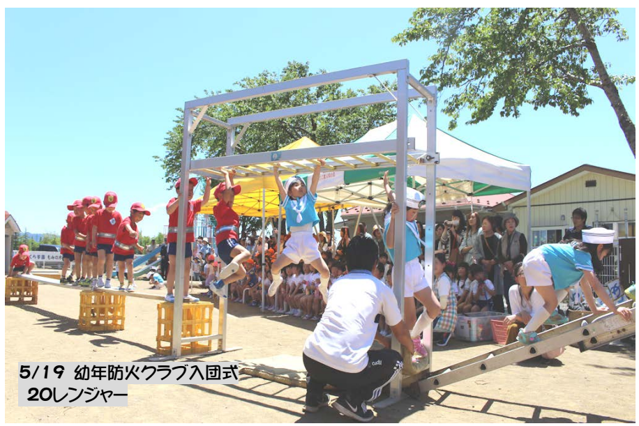
5/19 幼年防火クラブ入団式 20レンジャー