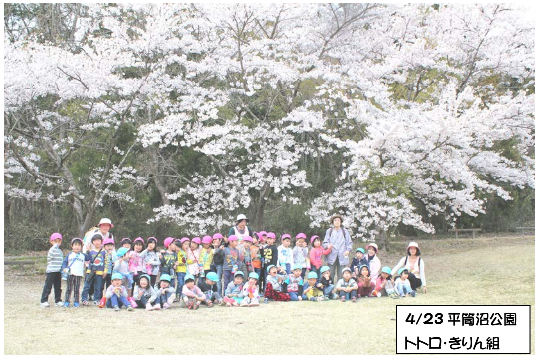
4/23 平筒沼公園 トトロ・きりん組