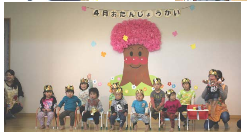
4/24 豊里 松風園