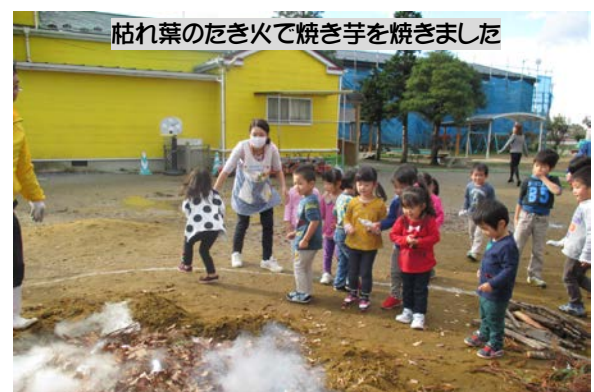
枯れ葉のたき火で焼き芋を焼きました