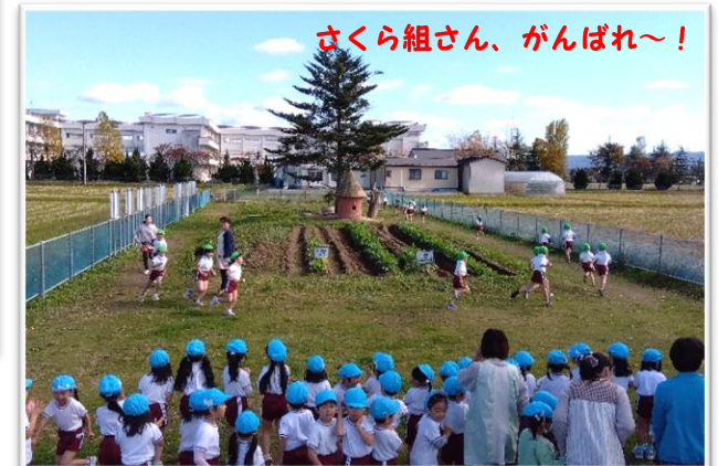
さくら組さん、がんばれ〜！