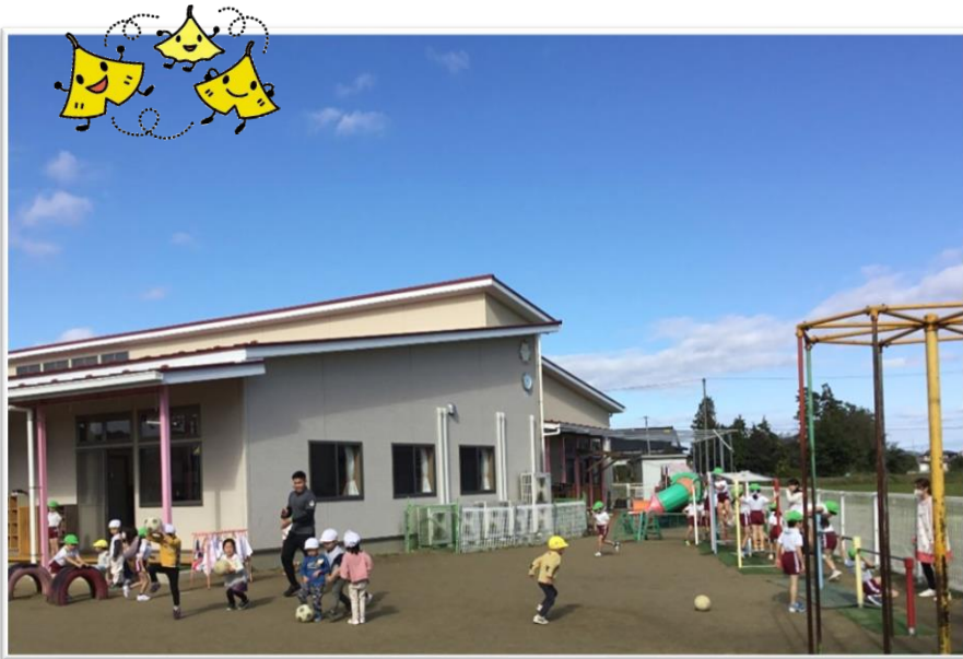
ALTサング先生とサッカー遊び・・・ひよこ組