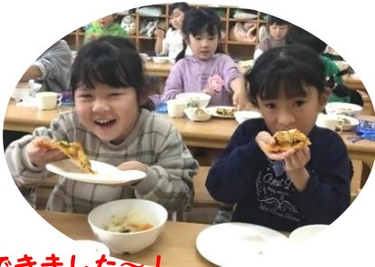
ピザ、おいしくできました～！