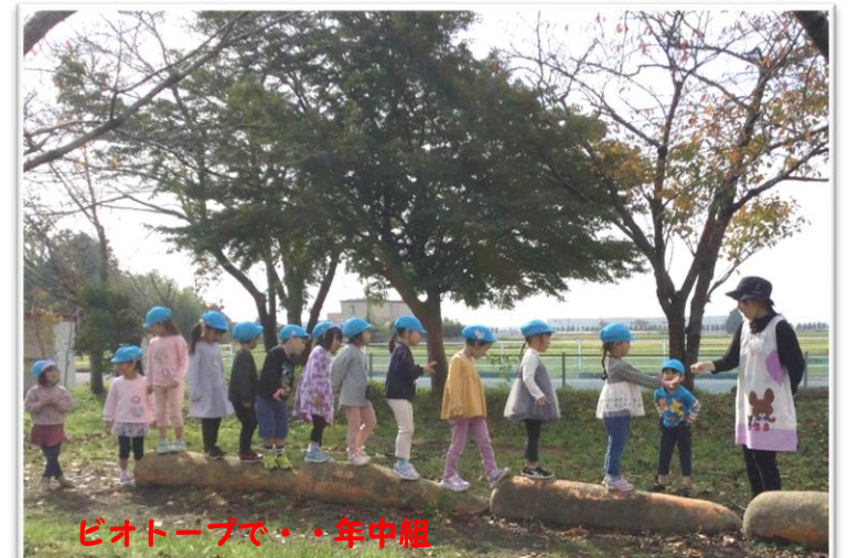
ピオトープで・・・年中組

旬の食材を使ったクッキング 秋の自然に触れながらの戸外 遊び、ハロウインの日は仮装 も楽しみました。年中フリー 参観では、様々な場面で頑張 る姿が見られました。R6. 11. 1