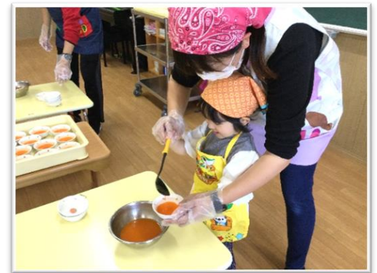
キャロットゼリー作り・ひよこ組