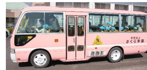
ピンクバスがピンク色にリニューアル!