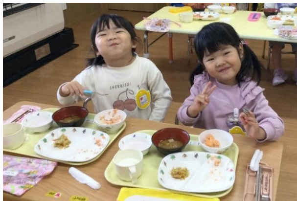
新米は、おかずの鮭と一緒にもりもり食べました!