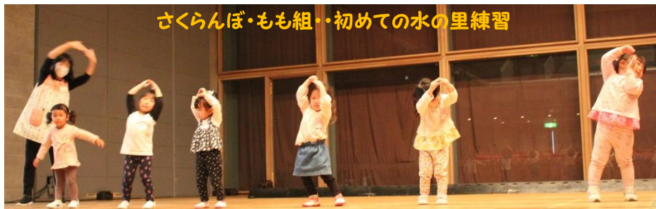
さくらんぼ・もも組・・・初めての水の里練習